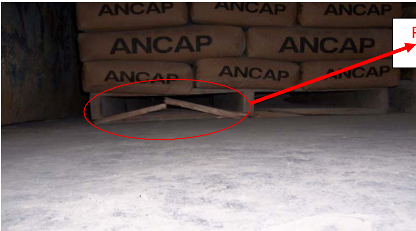
Pallet en mal estado = rechazado Quebrada primer tabla