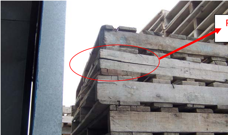
Pallet en mal estado = rechazado Quebrado soporte lateral