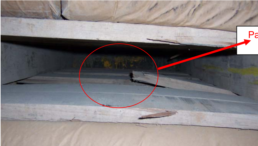
Pallet en mal estado = rechazado Tabla del medio quebrada