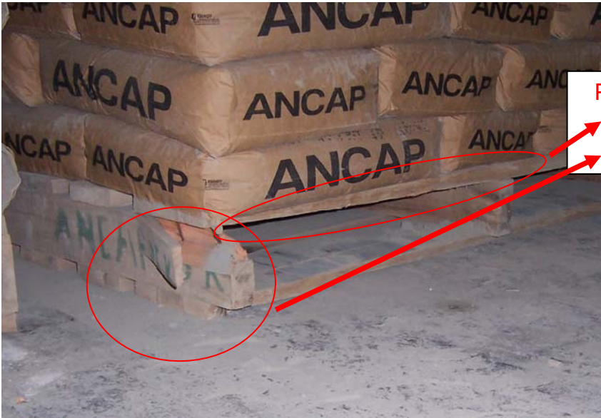
Pallet en mal estado = rechazado Quebrada primer tabla y soporte lateral.